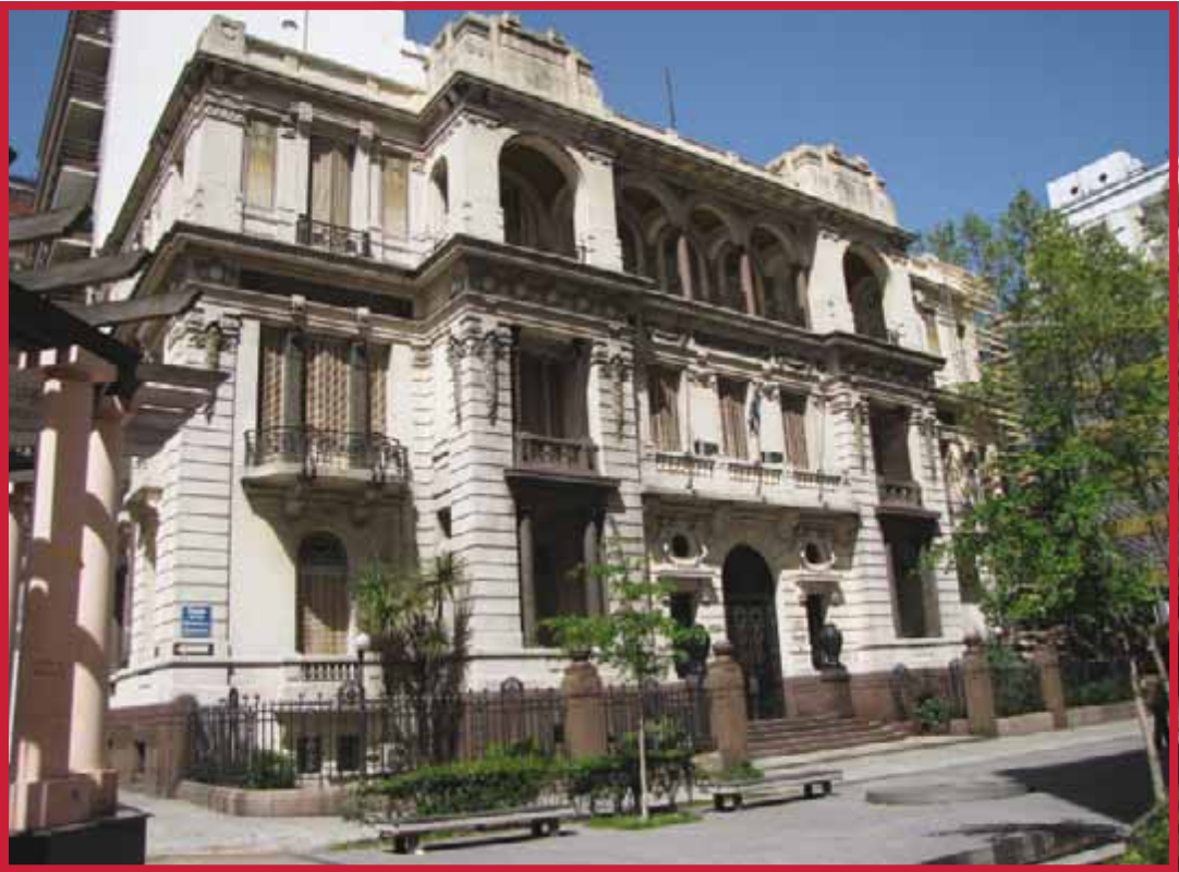
Sede de la Suprema Corte de Justicia, Montevideo.