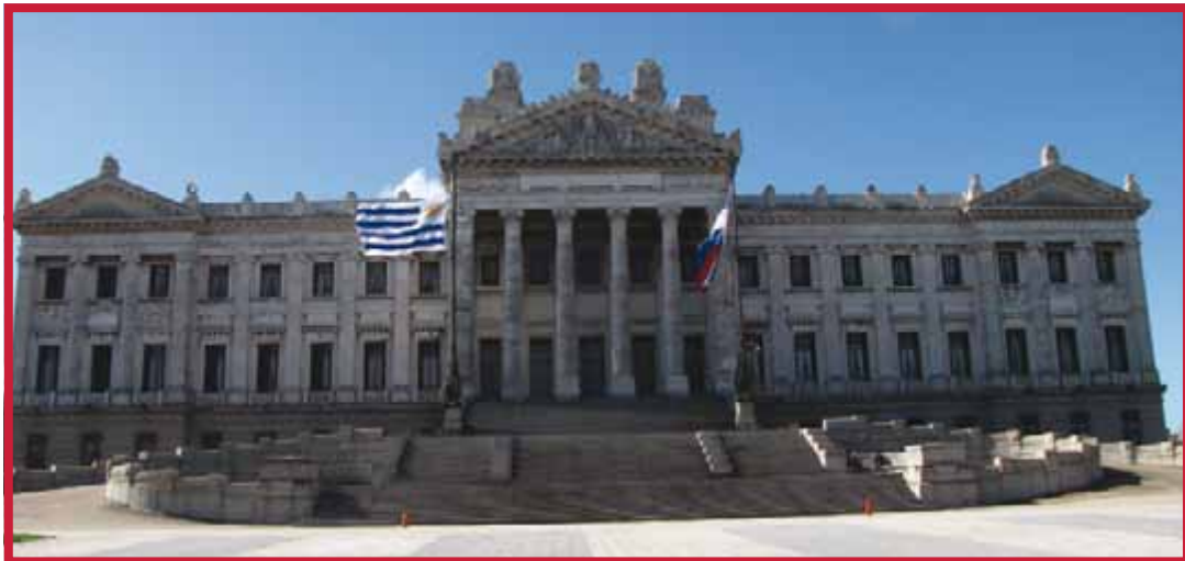
Palacio Legislativo, inaugurado el 25 de agosto de 1925, en el marco de la celebración del Centenario.