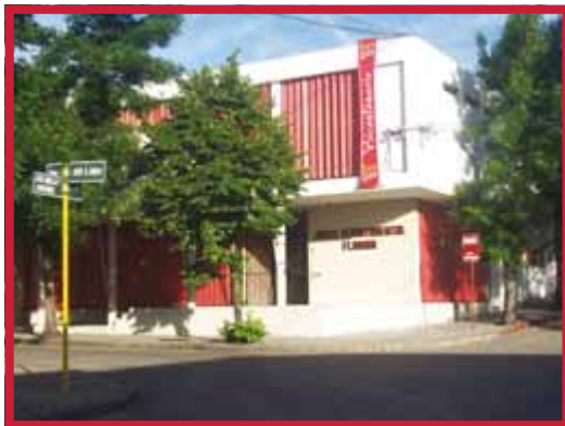
Junta Departamental de Florida.