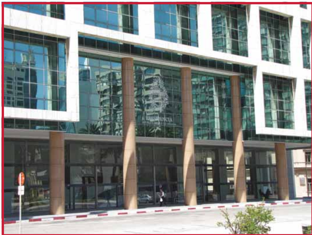
Casa de Gobierno en la Torre Ejecutiva. Sede del Poder Ejecutivo.

Te proponemos que trabajes con la metodología que te planteamos antes, en base al siguiente cuadro y con tu Constitución.