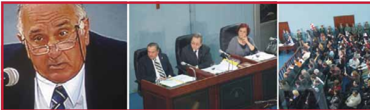
Partes intervinientes en un juicio.