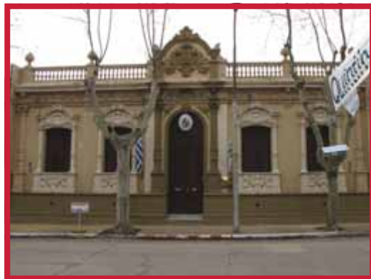
Intendencia Municipal de Treinta y Tres.